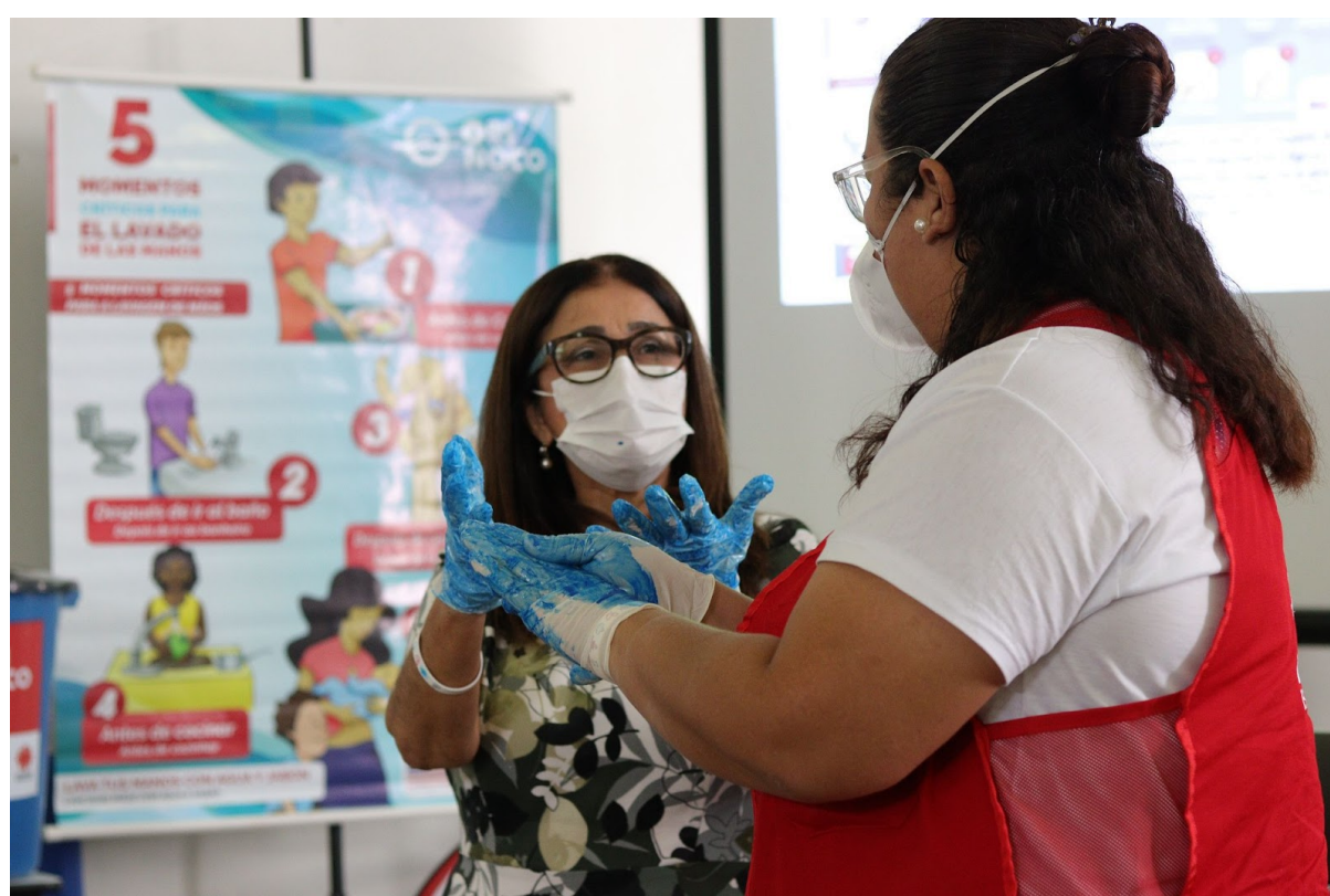
Atividade de lavagem de mãos durante visita técnica em Roraima